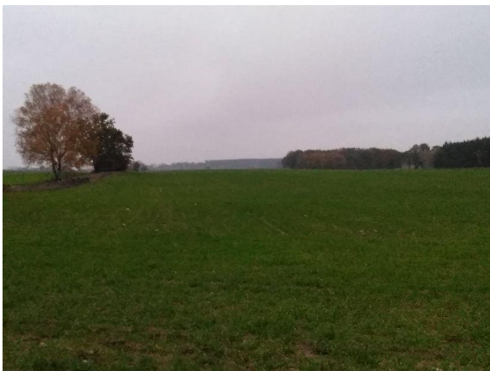
(Widok z działki na północ)