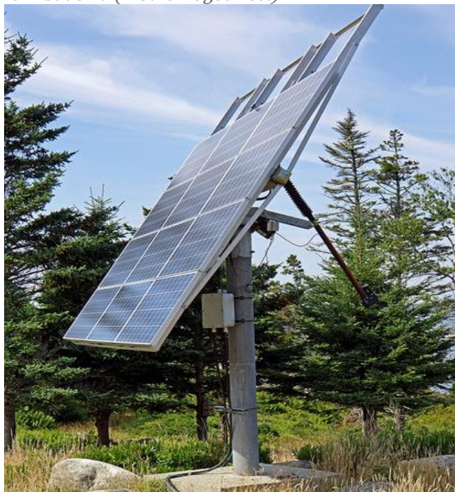
Rys. Solar tracker - budowa

W przypadku instalowania paneli fotowoltaicznych na konstrukcjach nośnych (trackerach) zostaną wykorzystane konstrukcje jedno lub dwuosiowe umożliwiające obrót paneli zapewniając tym samym wzrost ich efektywności. System ten jest oparty o ruchomy stelaż, który poruszany jest za pomocą silnika elektrycznego o mocy około 50W. Trackery sterowane są automatycznie lub w sposób wymuszony przy wykorzystaniu łącza bezprzewodowego. Planowane zapotrzebowanie na energię elektryczną dla 1 trackera wynosi około 3kWh/rok. Oddziaływanie silnika elektrycznego na klimat akustyczny jest znikome.