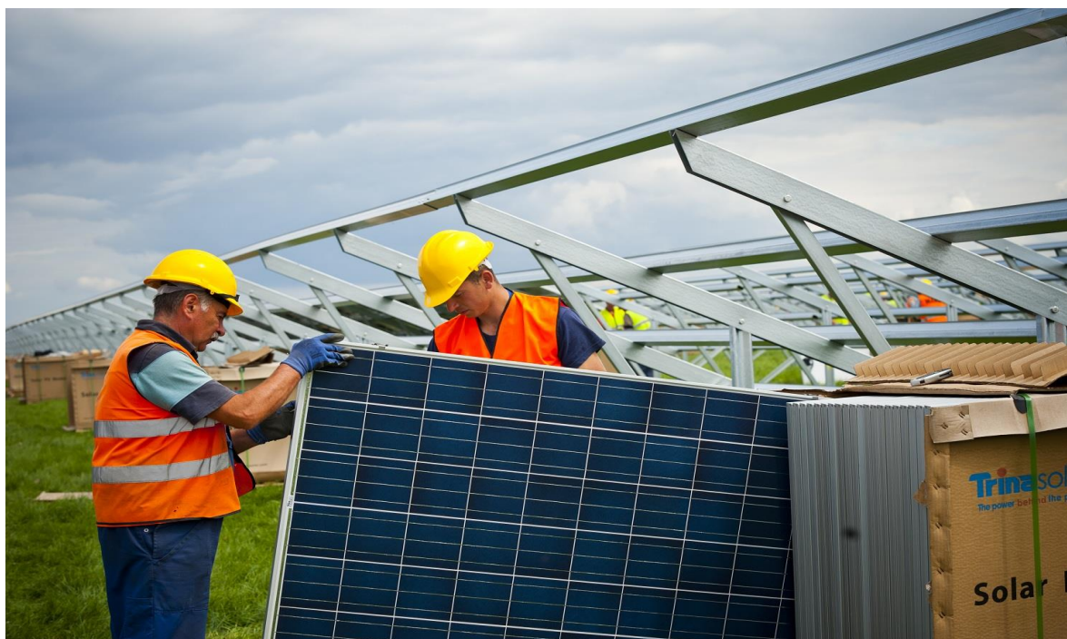
Zdjęcia. Budowa farmy solarnej Bautzen (Niemcy) 38MW na powierzchni ok. 70ha przez polską firmę Remor Solar z Recza (Remor Solar)

Ogniwa fotowoltaiczne pracują bezobsługowo. Montaż odbywa się w miejscu posadowienia z gotowych elementów bezpośrednio na gruncie. Montaż obejmuje wbicie (bądź wkręcenie) do gruntu konstrukcji mocujących w formie metalowych słupków, do których przykręcane są panele fotowoltaiczne, podłączane są przetwornice, inwertery i inne urządzenia wspomagające pracę ogniw. Panele fotowoltaiczne oddają ciepło przez konwekcję naturalną do przepływającego powietrza atmosferycznego. Jest to jedyny i w pełni wystarczający system chłodzenia. Nie przewiduje się montażu wentylatorów. Inwertery chłodzone są w ten sam sposób. Planuje się minimum 29-letni okres eksploatacji instalacji.