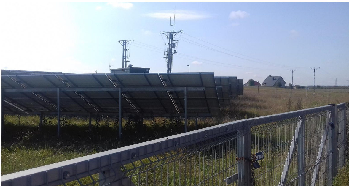
Zdjęcie. Przykładowe ogrodzenie wraz z systemem alarmowo – monitoringowym na farmie PV pod Lublinem