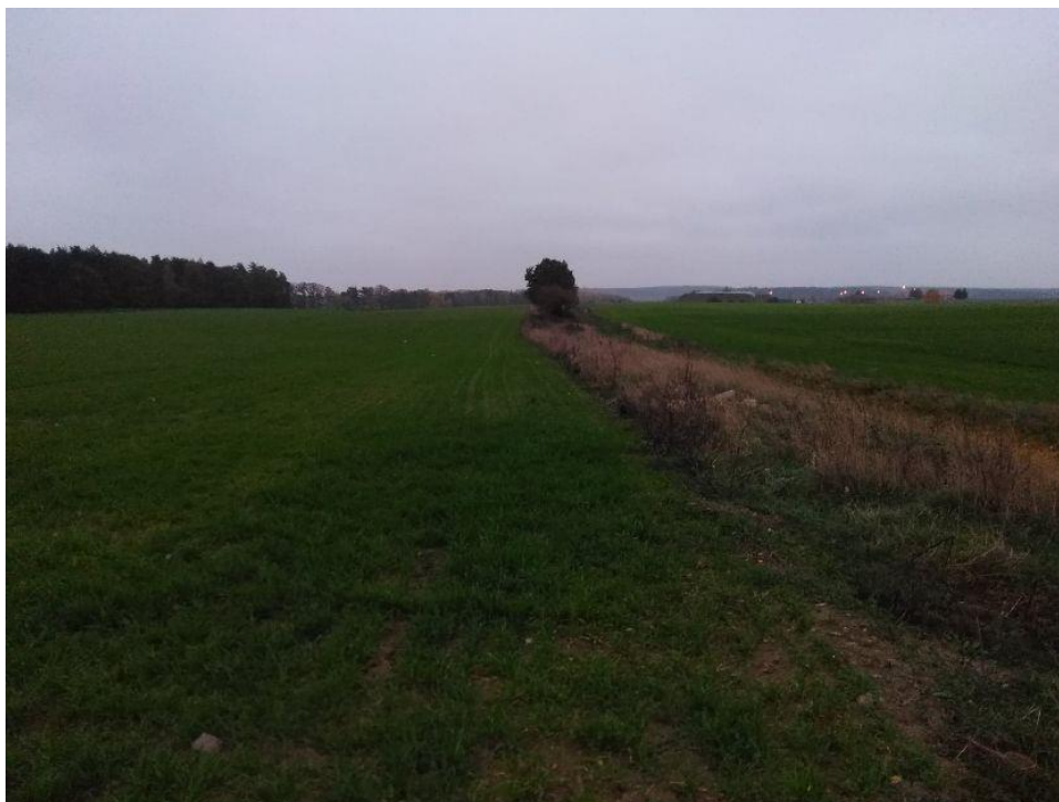
(Widok z działki na południowy wschód)

Po wykonaniu instalacji w czasie eksploatacji elektrowni słonecznej teren biologicznie czynny zostanie zachowany w dobrej kulturze rolnej tzn. planuje się zasianie trawy, która będzie koszona i usuwana co najmniej raz w roku. Na obszarze inwestycji nie planuje się wykonania fundamentów pod konstrukcje paneli fotowoltaicznych przez co profil gruntu pozostanie bez zmian. Ze względu na swoją charakterystykę inwestycja w żaden sposób nie wpłynie na stan prawny i faktyczny przyległych nieruchomości – ich właściciele będą mogli dalej je wykorzystywać według własnego uznania.