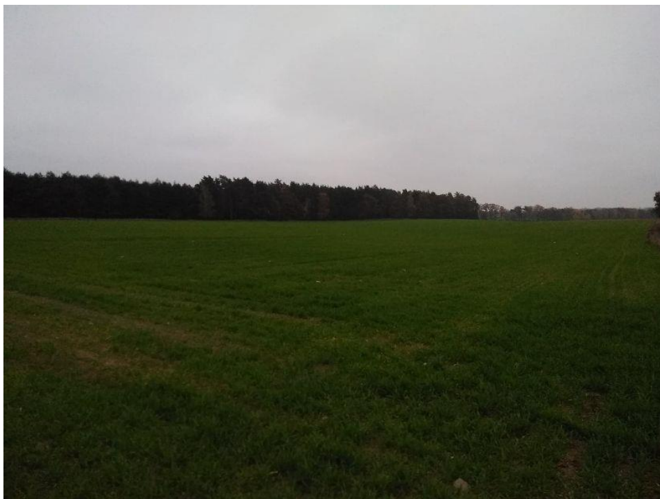
(Widok z działki na południe)